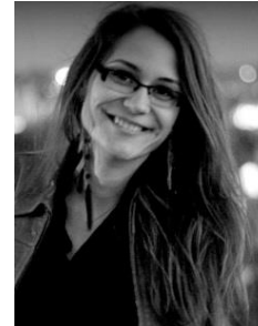
Praktikos projekto vadovė