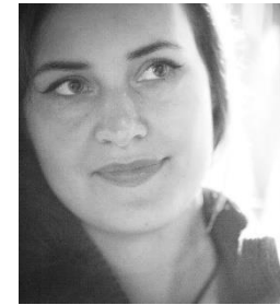
Reklamos projektų vadovė