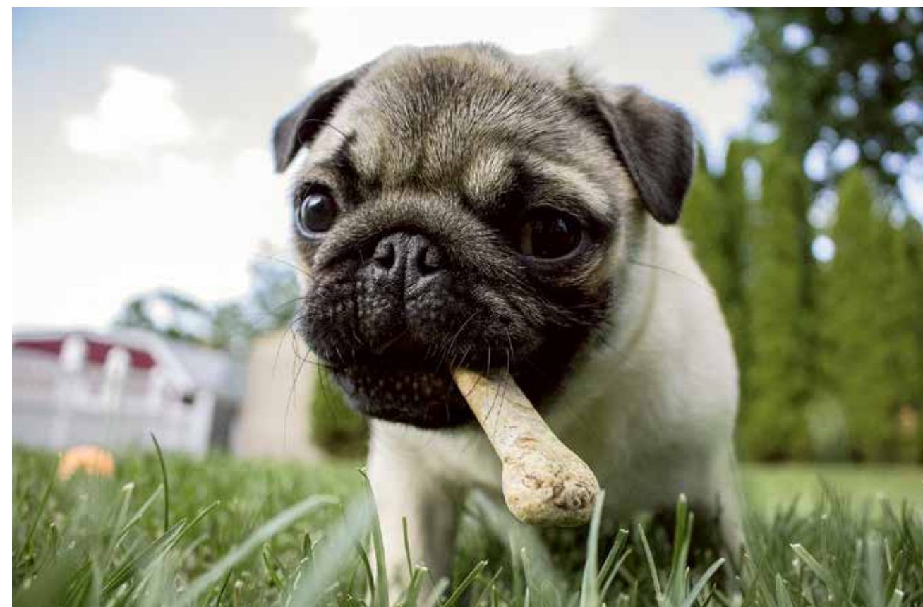
▲ Graūždamas specialius skanėstus, šuo drauge ir valosi dantis.

Pirmiausia yra svarbu įsigyti specialiai šunims skirtas dantų valymo priemones – dantų pastą bei dantų šepetėlį