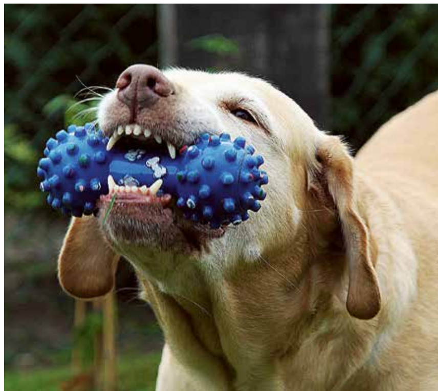
Ant guminių žaislų galima užtepti šunims skirtos dantų pastos.